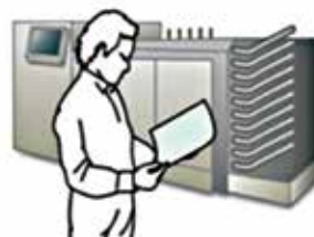
業務用フォトプリンター