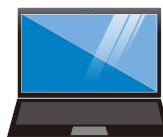
他社製品 ノートパソコン